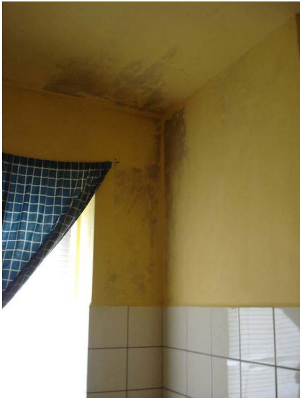
Vochtplek badkamer (rechterhoek)