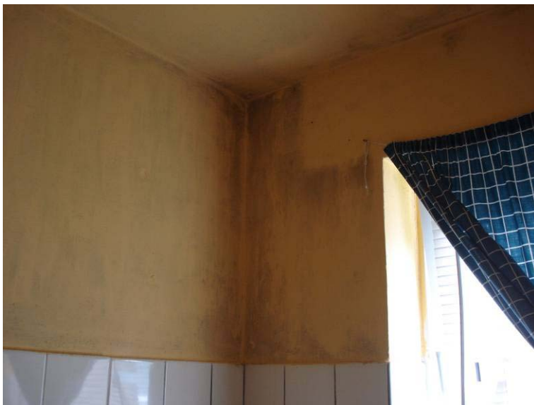
Vochtplek badkamer (linkerhoek)